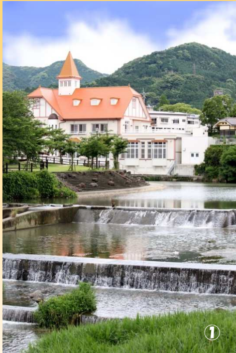
① 공중목욕탕 씨볼트노유