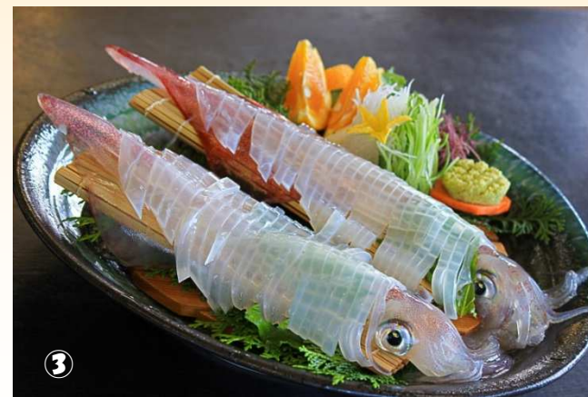
③ 사가현의 명물 오징어회